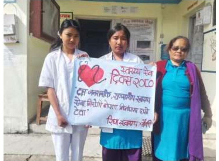
स्वास्थ्य सेवा दिवस @ रिघा स्वास्थ्य चौकी, बागलुङ्ग

दादुरा मिजल्स माइरसबाट हुने अति संक्रामक रोग हो। यो रोग कुनै पनि उमेरको मानिसलाई र विशेष गरि बालबालिकालाई लाग्न सक्दछ । अति संक्रामक भएको कारणले गर्दा, यो रोगले छिट्टै महामारीको रूप लिन सक्दछ ।