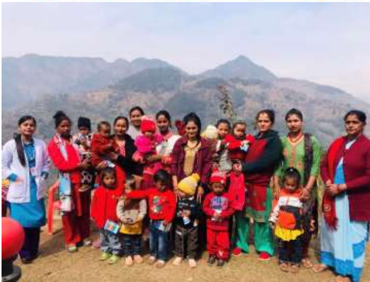
दादुरा रुबेला खोप अभियान @ पाङराड स्वास्थ्य चौकी, पर्वत

दादुरा संक्रमित बालबालिकालाई साविक मन्दा बढी पोषिलो खानेकुरा खुवाउने गर्नु । दादुरा भएका प्रत्येक बालबालिकालाई स्वास्थ्यकर्मीको सल्लाह अनुसार मिटागिन ए खुवाउनु पर्दछ।