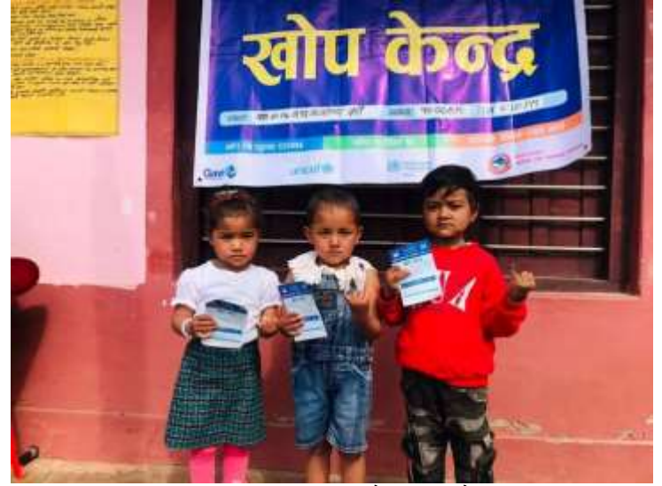
दादुरा रुबेला खोप अभियान @ दरौं, अर्जुनचौपारी गाउँपालिका, स्याङ्जा