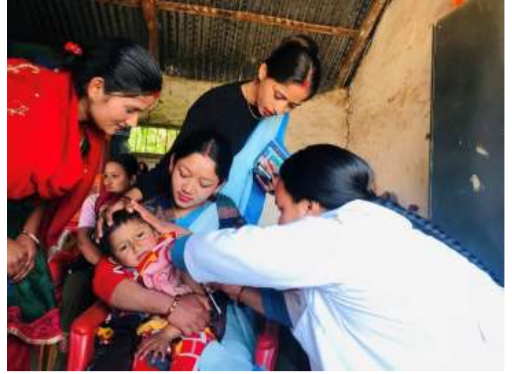
दादुरा रुबेला खोप अभियान २०८० @ पाङराङ स्वास्थ्य चौकी, पर्वत