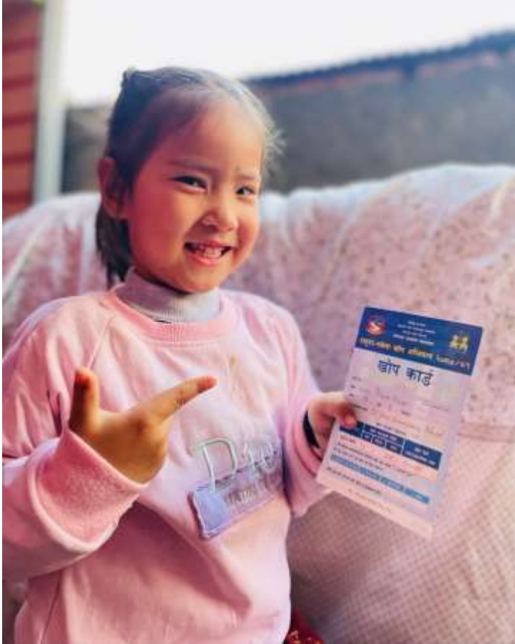
मैले त लगाए हजुरहरुले लगाउनु भयो दादुरा-रुबेला खोप?

गण्डकी प्रदेश सरकार सामाजिक विकास तथा स्वास्थ्य मन्त्रालय स्वास्थ्य निर्देशनालय पोखरा, नेपाल