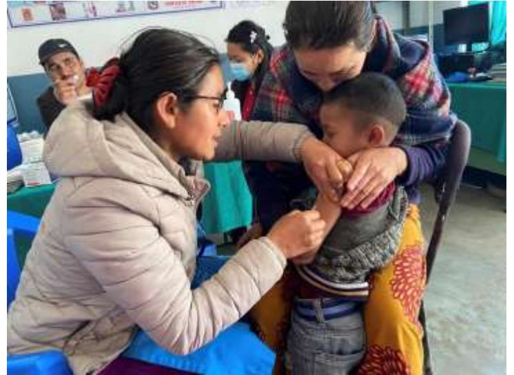
दादुरा रुबेला खोप अभियान २०८० @ खिलाङ सामुदायिक स्वास्थ्य इकाई, कास्की