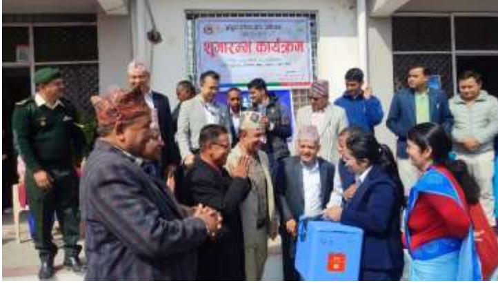
दादुरा रुबेला खोप अभियान २०८० @ ब्यास नगरपालिका, तनहुँ

गण्डकी प्रदेश सरकार सामाजिक विकास तथा स्वास्थ्य मन्त्रालय स्वास्थ्य निर्देशनालय पोखरा, नेपाल