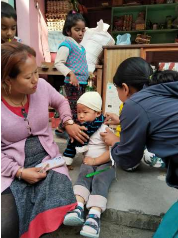
दादुरा रुबेला खोप अभियान २०८० @ खैरेनीटार स्वास्थ्य चौकी दुलेगौडा, तनहुँ

अंक १८२, वर्ष ५, २०८० फाल्गुन २०, March 3, 2024 आइतबार