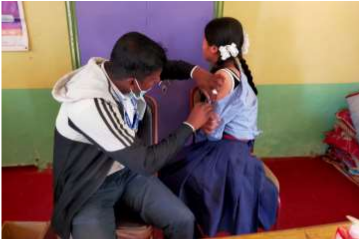
दादुरा रुबेला खोप अभियान २०८०, बौदिकालिका गाउँपालिका @ नवलपरासी ब.सु.पू.