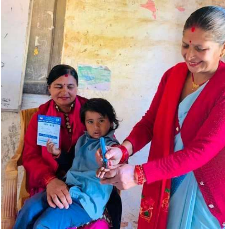
दादुरा - रुबेला खोप अभियान @ गहते अम्बोट आधारभूत विद्यालय