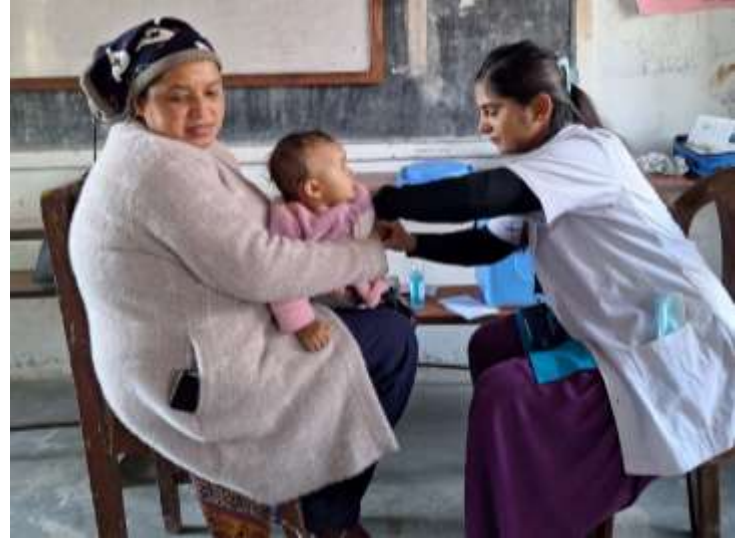
दादुरा रुबेला खोप अभियान २०८० @ कास्की