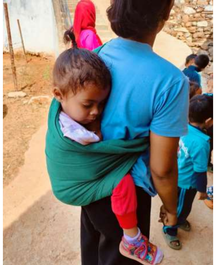
दादुरा रुबेला खोप अभियान २०८० @ आँबुखैरेनी, गाउँपालिका, तनहुँ